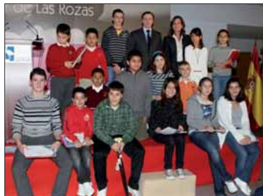
Un momento de la entrega de la pasada edición

El programa está cofinanciado por la Consejería de Empleo, Mujer e Inmigración. La próxima edición tendrá lugar del 17 al 24 de julio de 2010.