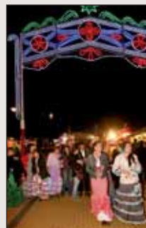
A la izquierda, un momento del transcurso del primer día de la Feria. En la imagen inferior, el Alcalde acompañado de algunos concejales tras el “alumbrado”

Destacó el momento del “alumbrado” a cargo del Alcalde de Las Rozas, y que dió inicio a la Feria.