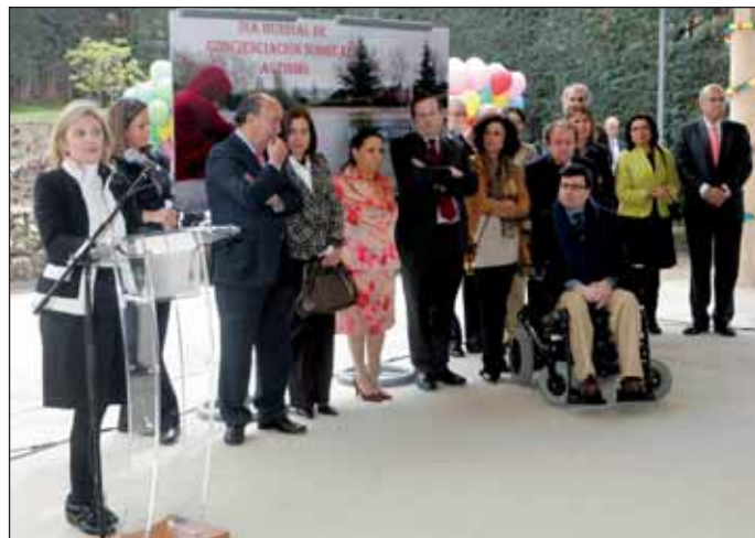
En la imagen, el acto institucional celebrado en las instalaciones de Nuevo Horizonte

red de atención social en la que se ha avanzado tanto en la creación de recursos como en la especialización de los mismos.