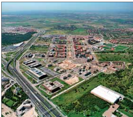
Vista aérea del parque empresarial

El Pleno extraordinario celebrado el pasado 2 de marzo aprobó el nuevo texto del Plan General de Ordenación Urbana (PGOU), un documento que tiene como objetivo que el municipio de Las Rozas se desarrolle de forma ordenada y sostenible; por ello, su diseño cuenta con un abundante número de espacios libres y con una completa red de equipamientos públicos. Esta sesión Plenaria se celebró como respuesta a la solicitud, por parte de la Comunidad de Madrid, de subsanación de deficiencias en relación con el documento maestro del PGOU presentado en su día. El documento aprobado contiene las correcciones y justificaciones precisas que responden a los re-