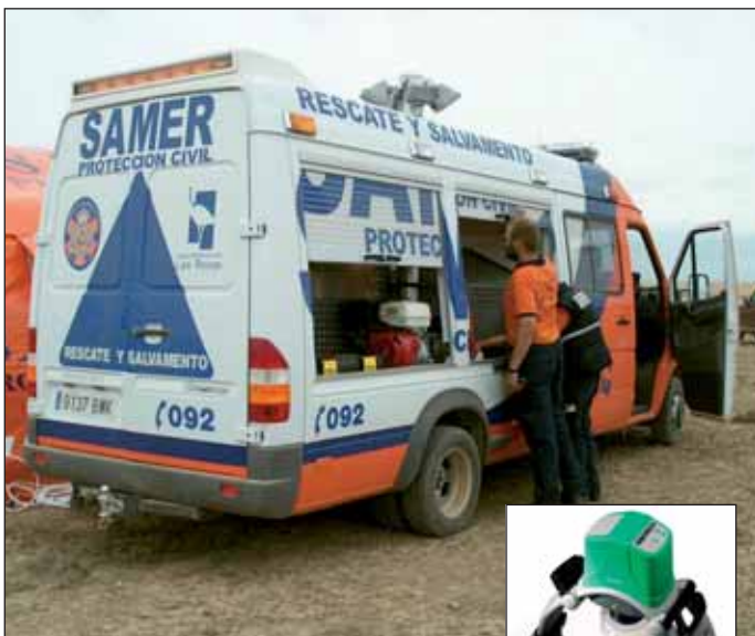
En la imagen, la UVI móvil de SAMER-Protección Civil; en el recuadro, el nuevo dispositivo

SAMER-Protección Civil, dependiente de la Concejalía de Seguridad y Protección Ciudadana, ha incorporado recientemente el dispositivo LUCAS2, el último sistema de cardiocompresión externa que existe en el mercado. Este dispositivo, portátil y de fácil colocación, permite la realización, en caso necesario, de masaje cardíaco externo. Su importancia radica en el hecho de que permite aumentar la eficacia de las compresiones ajustando la presión a la cavidad torácica del paciente. Frente a la reanimación manual, este dispositivo efectúa compresiones constantes, sin variar por el cansancio del reanimador, por lo que el resultado es una mejora del riesgo sanguíneo en el tejido cardíaco y cerebral aumentando las posibilidades de supervivencia del paciente y de su calidad de vida posterior. Posibilita, además, su traslado sin interrumpir las maniobras, incluso para realizar pruebas complementarias.