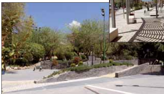
En las imágenes, la calle Real y el Parque de las Javerianas tras su remodelación

Esta Comisión esta integrada por técnicos de diferentes Concejalías y áreas municipales