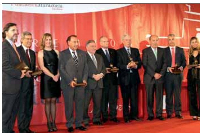
El Presidente de Honor, el Presidente y la Vicepresidenta junto a los premiados