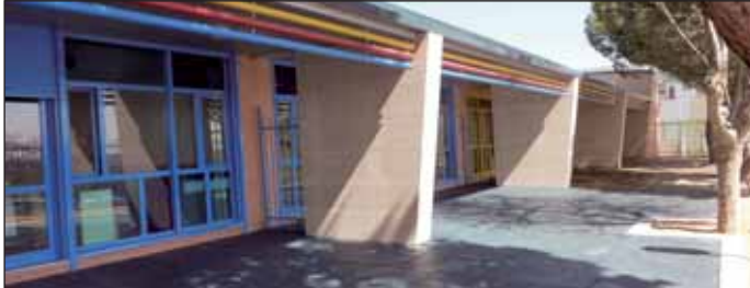
En la imagen, las aulas del Pabellón de Infantil

El Colegio San José de Las Matas estará listo para acoger a sus alumnos en el curso 2010-2011. Las obras de reforma y remodelación iniciadas en 2009 llegan así a su término. Estos traba-