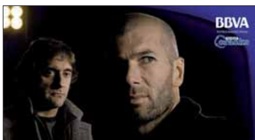
En la imagen, Zidane y Francéscoli

Según la Administración Central, Las Rozas se encuentra entre los diez ayuntamientos más saneados, entre los municipios con más de 50.000 habitantes