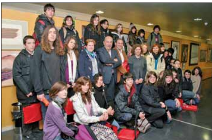
El Alcalde de Las Rozas junto la Concejala de Educación junto a los integrantes de la delegación

El Alcalde de Las Rozas recibió, el pasado 25 de febrero, a un grupo de alumnos del Collège du Pevèle, situado cerca de Lille, que se encontraban en Las Rozas con motivo de un intercambio escolar con alumnos del IES Federico García Lorca. La delegación que visitó al primer edil estaba compuesta por los 15 alumnos del centro francés, otros tantos del IES García Lorca, 2 profesores franceses, 2 españoles y el director del IES roceño; la delegación estaba encabezada por la Concejala de Educación. Es el tercer año consecutivo que se organiza este viaje de intercambio entre ambos centros educativos. Los alumnos franceses estuvieron varios días en el municipio. Durante su estancia también van a realizar visitas guiadas de tipo cultural y festivo, además de a Madrid, a diversas ciudades de los alrededores de la capital.