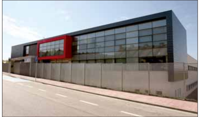
La fachada principal del edificio, en la C/Aristóteles

El 9 de abril tuvo lugar el acto oficial de inauguración del Nuevo Centro de Salud de Monterrozas, a cargo de la Presidenta de la Comunidad de Madrid y el Alcalde de Las Rozas . En el acto también estuvieron presentes el nuevo Consejero de Sanidad, el Concejale de Sanidad y Consumo de Las Rozas, así como una numerosa representación de concejales de gobierno y de oposición, y otras personalidades. El nuevo Centro se encuentra en la Calle Aristóteles y está distribuido en tres plantas. En la planta baja se ubican 30 consultas con sus zonas de espera, zona de radiología, zona administrativa y aseos. En la planta primera, a nivel de calle, se produce el acceso principal a través de una pasarela y se encuentran las zonas de fisioterapia y cinesiterapia, 16 consultas con sus zonas de espera, zona de extracciones, consultas de urgencias y curas , zona administrativa y aseos e instalaciones. La planta segunda está destinada al personal del centro y la planta semisótano se utiliza para garaje, almacenes e instalaciones.