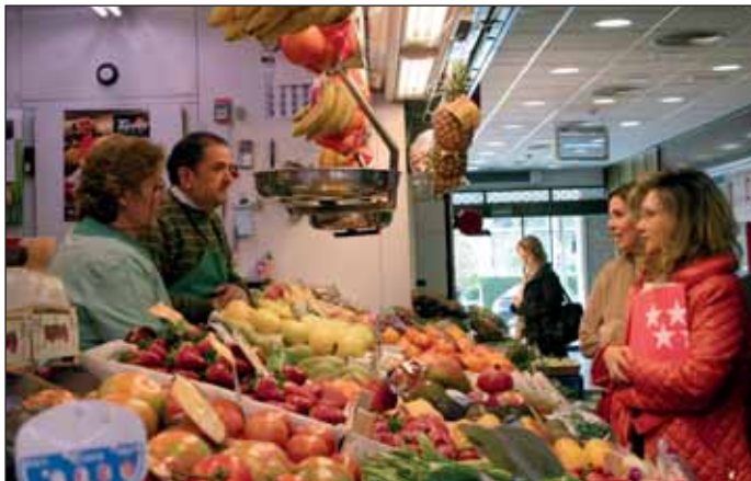
Un momento de la visita de la Directora General de Comercio y la Concejala de Economía a la Galería Comercial Las Rozas

El 16 de marzo la Directora General de Comercio de la Comunidad de Madrid visitó la Galería Comercial Las Rozas, situada en la calle Real, en pleno casco urbano del municipio, tras su reciente rehabilitación. Esta reforma, que ha sido posible gracias a la línea de