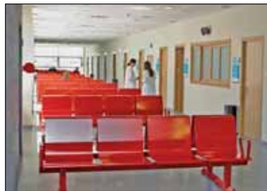
En la imagen superior, una de las salas de espera. A la derecha, la entrada principal del Centro

En la actualidad, el nuevo Centro de Salud presta servicio a unos 30.000 vecinos de Las Rozas, para lo que cuenta con un equipo integrado por 12 médicos de familia, 5 pediatras, 12 enfermeras, 6 auxiliares administrativos, 1 auxiliar de enfermería y 1 celador. Hay también toma de muestras, salas de cinesiterapia y de usos múltiples.