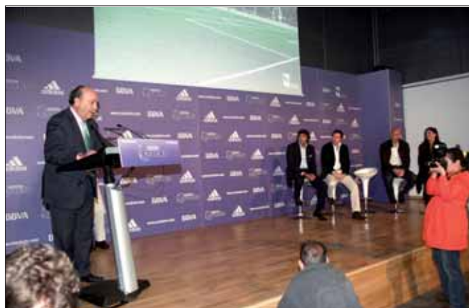
En la imagen, el Alcalde de Las Rozas durante la presentación de Football Cracks.