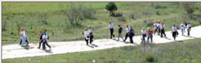
Un momento de la Marcha a su paso por la Dehesa

El pasado 28 de abril volvió a celebrarse la Marcha de Personas Mayores. Esta actividad, organizada por la Concejalía de Atención Social e Integración en colaboración con la Concejalía de Deportes, tiene como objetivo promocionar la práctica del ejercicio físico y el deporte al aire libre como uno de los hábitos de vi-