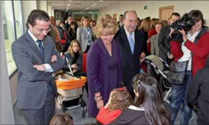
De izquierda a derecha, el Consejero de Sanidad, la Presidenta de la Comunidad y el Alcalde de Las Rozas en un momento de la visita