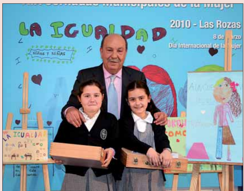
En la imagen, el Alcalde junto a las ganadoras, alumnas del Santa María de Las Rozas

El premio estaba compuesto por un maletín de pinturas y un diploma. En el mismo acto institucional, al que asistió el alumnado participante en compañía de sus profesores y profesoras, recibieron también sus premios los tres trabajos finalistas.