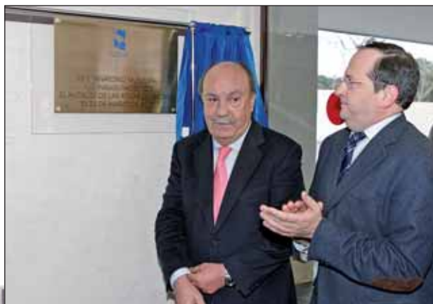
Sobre estas líneas el Alcalde y el Concejales de Presidencia tras descubrir la placa. En la imagen inferior, una de las salas de velatorio

Esta nueva infraestructura, cuya concesión estará a cargo de Interfunerarias durante 20 años, se encuentra situada en la Avenida de Nuestra Señora del Retamar; su disposición permite, así, crear una nueva fachada para el Cementerio Municipal. El nuevo edificio, de 2.000 m 2 , está distribuido en 2 plantas, en las que se reparten 2.000 m 2 construidos. Dispone de cinco salas de velatorio, capilla, sala de autopsias y tanatopraxia, floristería, almacén de féretros con muelle de descarga, zona administrativa, etc. El Tanatorio cuenta, además, con paneles solares y está prevista la instalación de paneles fotovoltaicos, dentro del Plan Municipal que promueve la utilización de energías renovables.