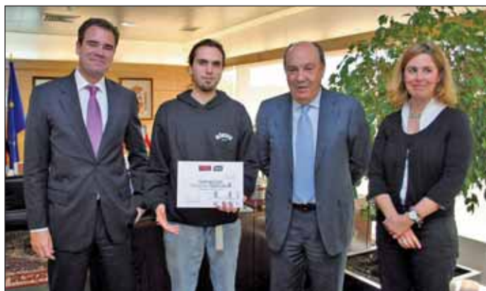
De izq. a dcha., el Presidente de Zed Group, el ganador del concurso, y el Presidente y la Vicepresidenta de la Fundación

pio. El acto de entrega del citado premio estuvo presidido por el Presidente de la Fundación Marazuela y Alcalde de Las Rozas, acompañado por la Vicepresidenta de la Fundación y Concejala de Economía, Empleo, Agentes Sociales e Innovación y el Presidente de ZED Group. El premio consistió en un cheque por valor de 1.000 euros. El videojuego premiado está ideado para teléfono móvil y destacó por su calidad y nivel de desarrollo. "Aero 1.0" es un simulador de vuelo en el que el jugador debe controlar un avión, esquivando obstáculos y atendiendo las necesidades propias de un avión como es su mantenimiento o el repostaje de combustible.