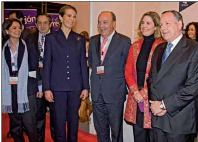
En la imagen, un momento del acto oficial de inauguración de la Feria

que acompañaron durante el recorrido oficial a S.A.R. la Infanta Doña Elena, Presidenta de Honor de la Feria; también estuvieron presentes la Consejera de Empleo y Mujer y el Presidente de IFEMA.