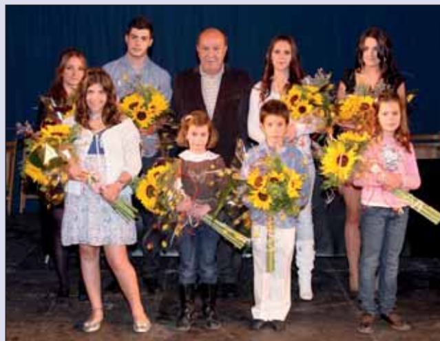
El Alcalde junto a los Reyes, Reinas y Damas de Honor de San José 2010