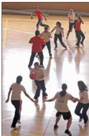
En las imágenes, algunas de las competiciones de las distintas disciplinas deportivas