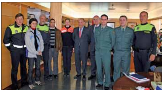
En la imagen, el Alcalde roceño junto a los representantes de las áreas municipales y otras instituciones firmantes

Se entiende que un menor se encuentra en situación de desprotección cuando tiene necesidades básicas sin satisfacer durante un periodo de tiempo suficiente como para provocar un daño significativo en su salud y desarrollo o colocándole en riesgo de sufrirlo. En el transcurso del acto, el Alcalde incidió en la necesidad de que la ciudadanía se sensibilice con este problema y comunique a las autoridades cualquier posible situación de desprotección, maltrato o abandono que conozca.