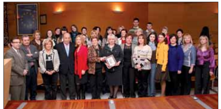
La delegación moscovita junto al Alcalde de Las Rozas y concejales del Equipo de Gobierno

años, se concede tras una rigurosa selección realizada por el Sindicato de los Trabajadores de la Educación, institución que se encarga de supervisar y financiar el viaje. Este encuentro se enmarca dentro del convenio firmado entre Moscú-Norte y Las Rozas en 2007.