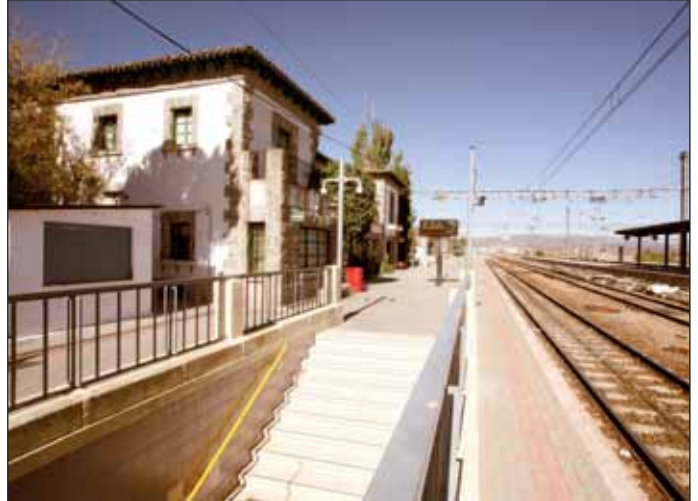
Los nuevos carriles bici y aceras llegarán hasta la estación de El Pinar

Este proyecto pretende acabar con un punto negro debido a la gran barrera que, hasta la fecha, ha supuesto la existencia de la A6 y la M50, en la zona. El recorrido de este nuevo carril bici, al igual que el creado desde la Dehesa de Navalcarbón a Monterrozas en 2009 y el que se va a realizar de nexo con El Cantizal fueron estudiados y propuestos por el Plan de Movilidad Urbana Sostenible, documento de trabajo de la Concejalía de Transportes y Comunicaciones para mejorar la movilidad urbana y por tanto, la calidad de vida en Las Rozas.