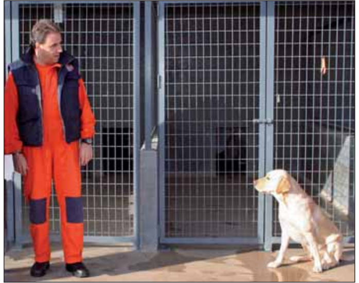
Uno de los voluntarios que participaron en la delegación de Haití junto a Pepe, el perro de rescate

catástrofes ha recibido la Medalla de Oro del Ayuntamiento de Las Rozas, el Reconocimiento de la Comunidad de Madrid-Madrid Agradecido y la Medalla de Honor del Ayuntamiento de Madrid.