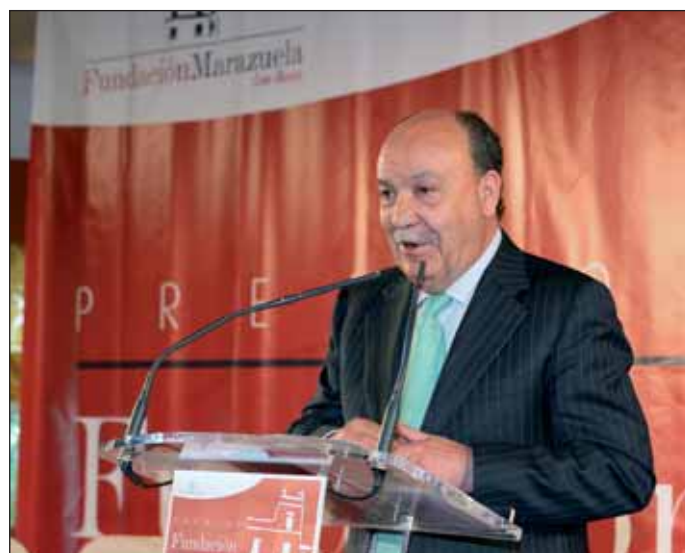
El Presidente de la Fundación y Alcalde de Las Rozas en su discurso inaugural