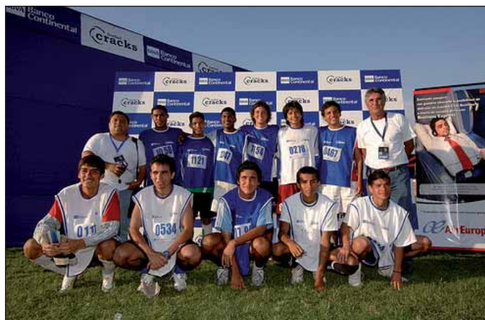
En la imagen, los seleccionados