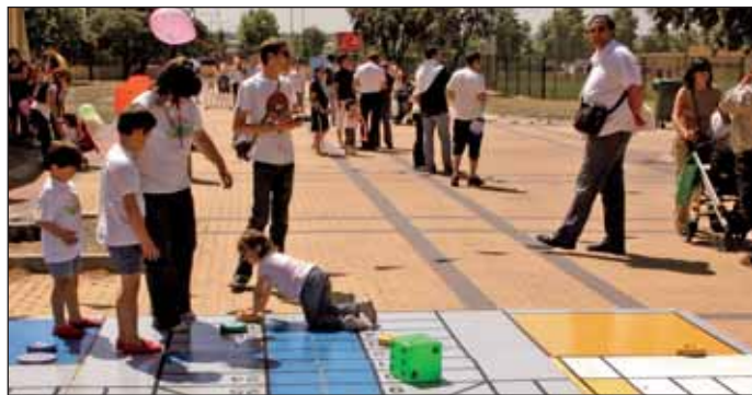
En las imágenes, sendos momentos de la pasada celebración del Día de la Familia

En ese día, también se habilitarán hinchables y para reponer fuerzas, se ofrecerá una paella gigante. Los asistentes podrán participar de forma gratuita de todas las actividades. Una representación del SAMER-Protección Civil y la Policía Local así como de la Guardia Civil con su unidad canina y los Bomberos de la Comunidad de Madrid darán a conocer las funciones que realizan y el servicio que prestan. Se estima una asistencia de unas 2.000 personas a lo largo de la jornada. Además se volverá a contar con la colaboración de la Fundación de Ayuda contra la Drogadicción (FAD) para la realización de las actividades de sensibilización, prevención e información en materia de drogas. Además, la Fundación Pfizer promoverá hábitos de vida y de alimentación saludables.