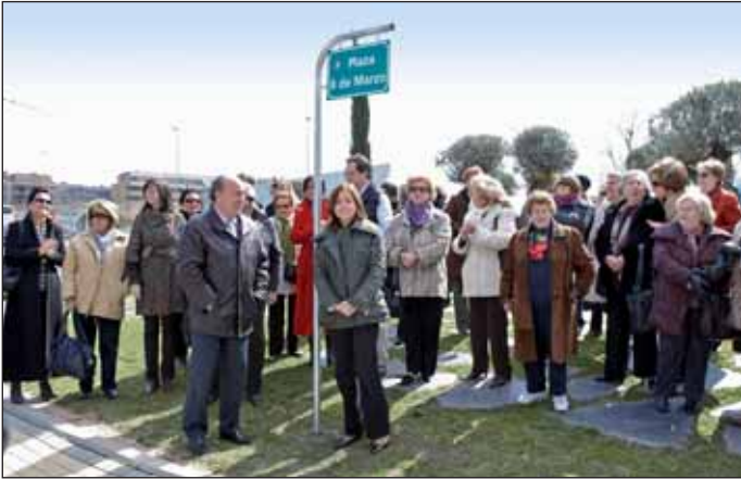
El Alcalde junto a la Concejala de Atención Social e Integración y otros ediles tras el descubrimiento de la placa

El día transcurrió con la tradicional concentración por la igualdad en la Plaza Mayor, y el descubrimiento de la placa de la plaza 8 de marzo, sita en la intersección de la Avda. Ntra. Sra. del Retamar, la C/Marie Curie en El Montecillo, y la C/Luxemburgo en Európolis. La mañana finalizó con el homenaje a las asociaciones y talleres del área de mujer de la Concejalía de Atención Social e Integración.