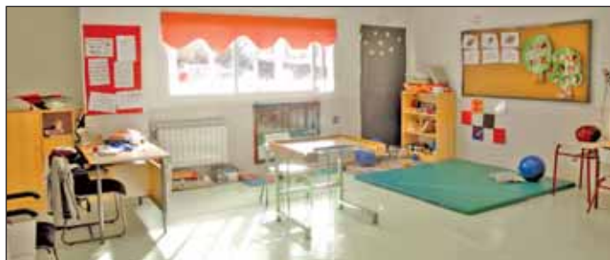
En la imagen, el Centro Monte Abantos

La Concejalía de Atención Social e Integración ha renovado diversos convenios de apoyo a la atención y la integración de las personas con discapacidad en el municipio. Destaca el firmado con la Fundación Nuevo Horizonte, que contribuye a la labor de apoyo integral y continuado a las personas afectadas de autismo realizada por esta institución radicada en Las Rozas. Otro convenio renovado es el firmado con la Asociación Española de Esclerodermia, y que con-